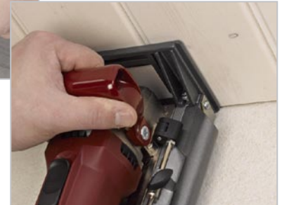
Fräsen von Schattenfugen