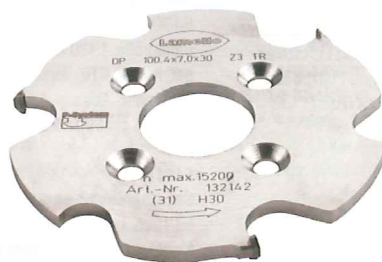
Lamello Diamant Fräser mit P-System.

Der Clamex P Verbinder wird formschlüssig in die T-Nut eingeführt und ohne Klebstoff oder Schraube befestigt.