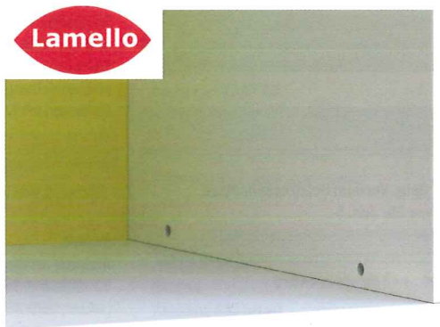
Minimale Bedienungsöffnung für einen Sechskantschlüssel.

Diese Hubmechanik zeichnet sich durch eine zuverlässige, mechanische, verschleissarme Technik aus und ist ausgesprochen bedienerfreundlich. Der Profilschnitt wird in der richtigen Tiefe automatisch ausgelöst.